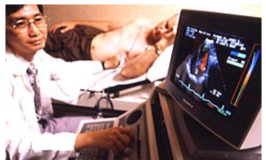
Realización de un ecocardiograma o ultrasonido

Este estudio suele tomar un máximo de 45 minutos. No debe sentir dolor ni molestia alguna durante la realización